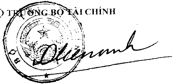
Đinh Tiến Dũng